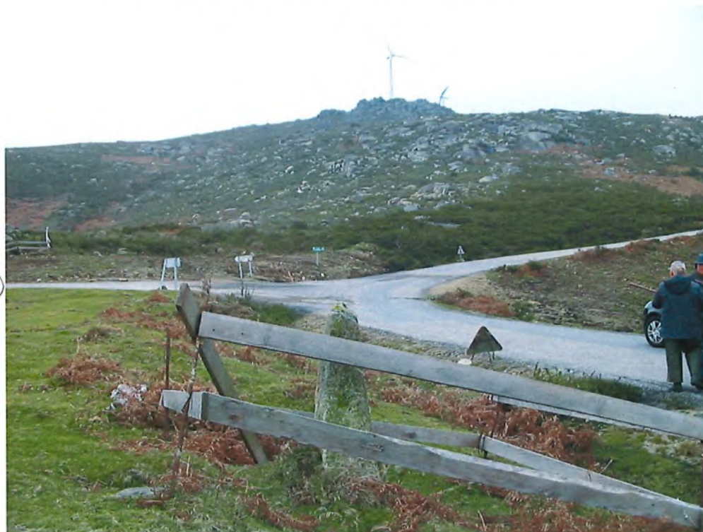
Fotografía nº 2- Vista del cruce y del marco del lugar "Porto da Arca"