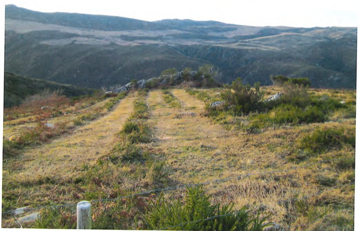
Fotografía nº 3- Vista del lugar conocido como Pedro Rincón

Existe en el punto así conocido y delimitado en la planimetría de la Carpeta Ficha, coincidente con una muralla rocosa, situada en las coordenadas UTM (ED50) X=0558000 Y=4689653