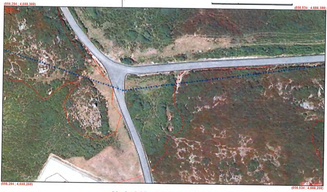
Vuelo del lugar "Porto da Arca"