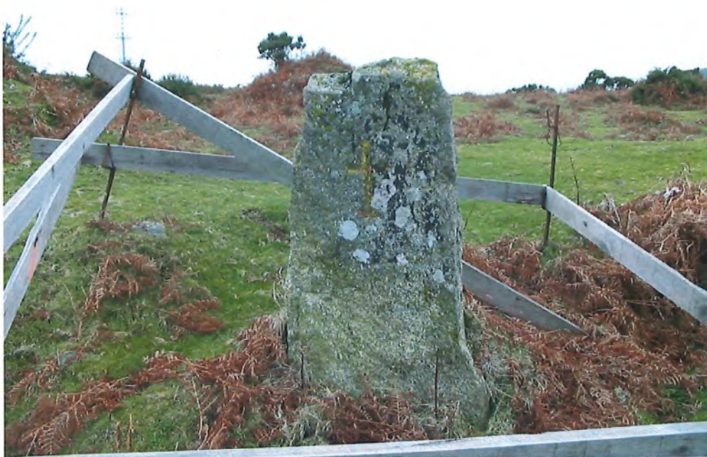
Fotografía nº 1- Marco del lugar "Porto da Arca"

Este lugar se encuentra referenciado en el Mapa Topográfico Nacional (E. 1:25.000 y E. 1:50.000 y el de 1.941 ) hoja 186-IV y en el plano de la COTOPV (E 1:5000) se adjuntan copias de ambos planos.